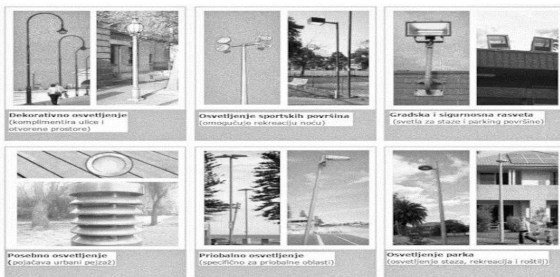
Slika 1. Različite vrste osvetljenja otvorenog prostora [1]

Osvetljenje otvorenog prostora igra važnu ulogu u obezbeđivanju bezbednosti, funkcionalnosti i atmosfere u različitim javnim prostorima kao što su parkovi, sportska igrališta, trgovi, itd. Ono ima specifične potrebe i zahteve u poređenju sa unutrašnjim osvetljenjem, uzimajući u obzir otvorenu prirodu okruženja.